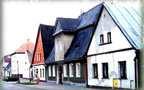
Małomiasteczkowa zabudowa z Zdunach