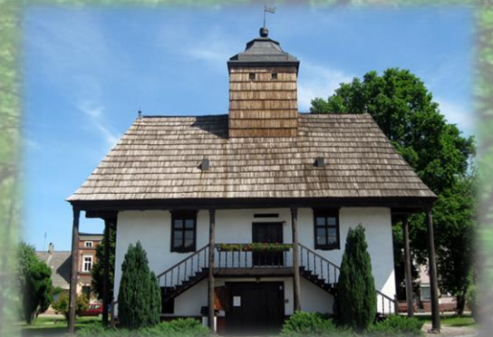
Ratusz w Sulmierzycach