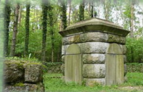
Mauzoleum Emila Schrapego